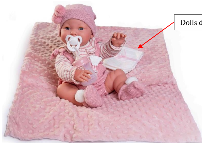
Dolls diaper SA001